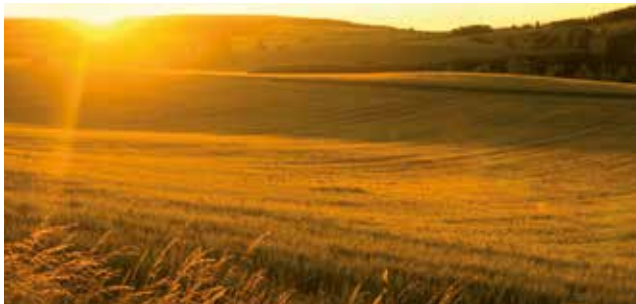
Natural grown durum wheat semolina

Bechtle is made with only the best quality durum wheat semolina and fresh eggs. Transparency to the customer is a big part of our philosophy. By working closely with our suppliers, farmers and millers, we can ensure excellence. We are proud to say that our entire supply chain is completely non-GMO.