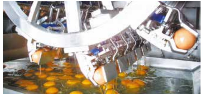
Fresh cracked eggs

The advantages of Bechtle Egg Pasta are its natural taste, golden color, and enhanced cooking characteristics.