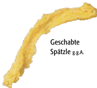
Geschabte Spätzle g.g.A.