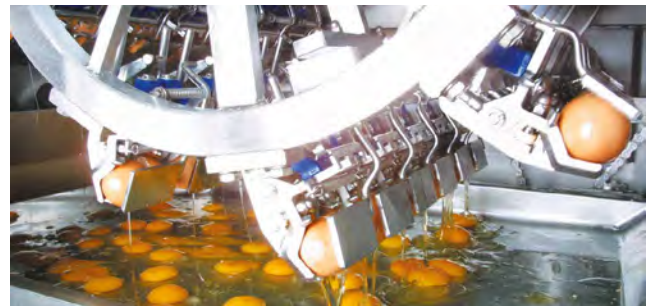
Fresh cracked eggs

The advantages of Bechtle Egg Pasta are its natural taste, golden color, and enhanced cooking characteristics.