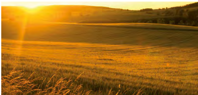
Natural grown durum wheat semolina

Bechtle is made with only the best quality durum wheat semolina and fresh eggs. Transparency to the customer is a big part of our philosophy. By working closely with our suppliers, farmers and millers, we can ensure excellence. We are proud to say that our entire supply chain is completely non-GMO.